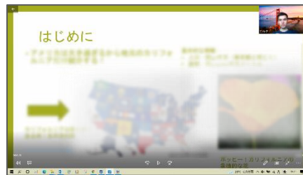
アメリカ(カリフォルニア州)