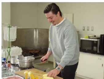
2006年 料理教室 (オーストラリア)

在住外国人や留学生等と地域での共存・交流を目指して様々なイベントを行っています。中でもカレーレビュー、世界の料理教室は大好評で交流イベントとして定着しています。